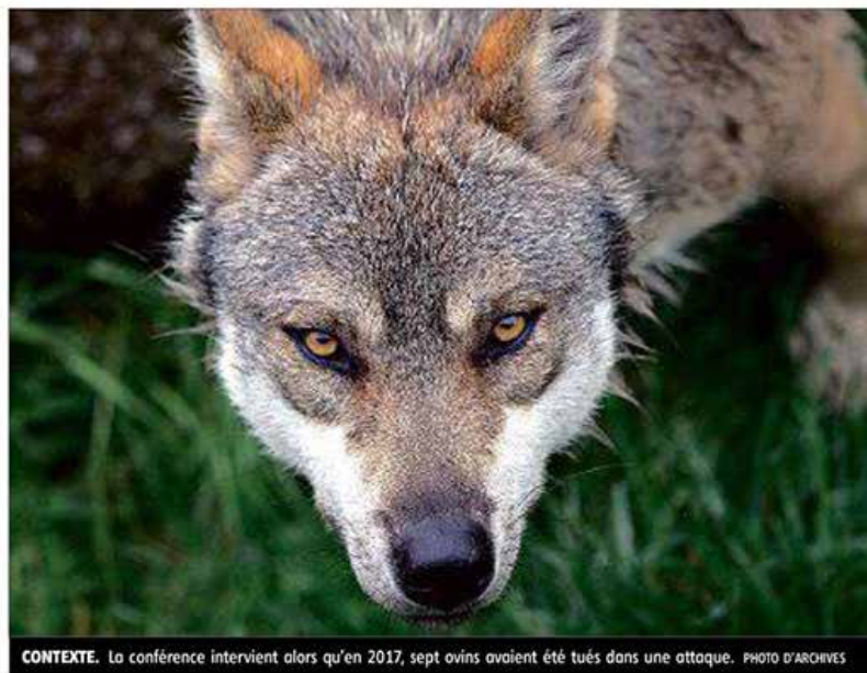
CONTEXTE. La conférence intervient alors qu'en 2017, sept ovins avaient été tués dans une attaque.