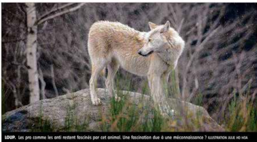
LOUP. Les pro comme les anti restent fascinés par cet animal. Une fascination due à une méconnaissance ? ILLUSTRATION JULIE HO NGA

Loup y-es-tu ? « En France, on estime qu'il peut y avoir 72 meutes mais on sait aussi qu'il y a des meutes fantômes, a détaillé cet éthologue, fondateur notamment de l'Institut pour la promotion et la recherche sur les animaux de protection (IPRA). Ces dernières années, il y a eu une explosion des populations dans les Alpes italiennes, suisses et françaises. Avec les capacités de dispersion qu'il a, le loup peut se retrouver n'importe où. Pour l'instant, il ne passe pas trop la vallée du Rhône mais on ne peut rien prédire. » Un loup