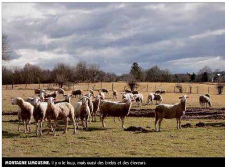
MONTAGNE LIMOUSINE. Il y a le loup, mais aussi des brebis et des éleveurs.