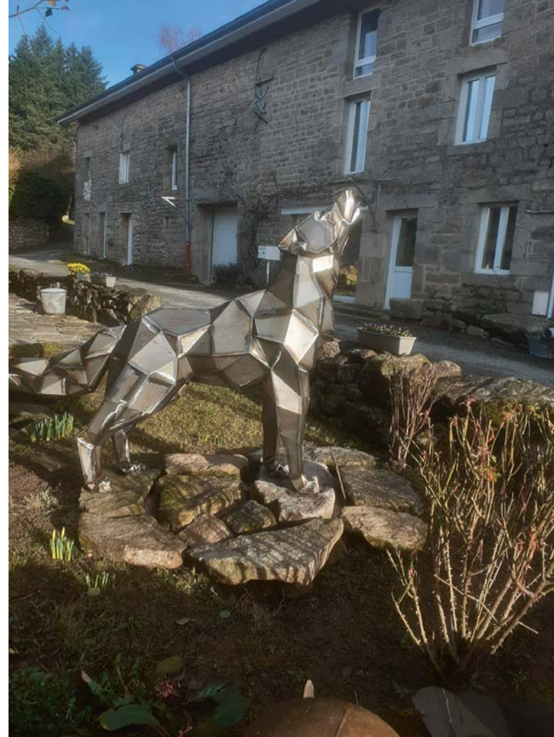
Vous ne l'avez pas vu ? Pourtant le loup est là. Il hurle à la mort chaque nuit du côté de Quenouille sur la commune de Peyrat-le-Château !