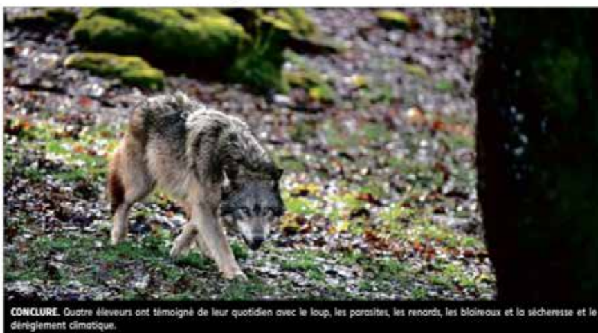
CONCLURE. Quatre éleveurs ont témoigné de leur quotidien avec le loup, les parasites, les renards, les blaireaux et la sécheresse et le dérèglement climatique.

C'est dans ce contexte que Quartier Rouge vient d'organiser une semaine de rencontres et de pratiques pour imaginer des scénarios de cohabitation avec le loup sur la montagne limousine. Elle a invité