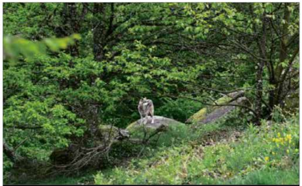
ENVIRONNEMENT. Le loup est désormais présent en Montagne limousine.

Cette expérience propose de penser la manière dont la ferme et son environnement deviennent un espace politique, un laboratoire d'avenirs. Elle vise également à prototyper ou identifier des assemblées de territoire pertinentes pour formuler de nouveaux scénarios et des ma-