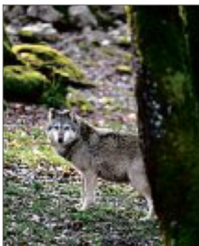
TERRITOIRE. Les étudiants travaillent notamment sur les enjeux de cohabitation liés notamment au retour des loups. ILLUSTRATION

de diagnostiquer finement les positions, les histoires et les cheminements de chacun des acteurs et de mettre en lumière des points d'appui et des leviers d'action d'une stratégie possible pour mener une action publique par la suite.