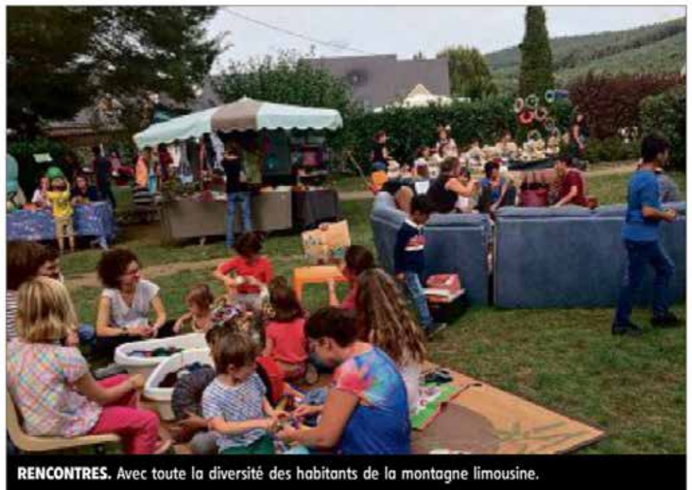
RENCONTRES. Avec toute la diversité des habitants de la montagne limousine.

Cette fête se veut le reflet de la vie et du dynamisme du plateau de Millevaches et de ses habitants et habitantes : stands d'associations et de producteurs, débats, rencontres, spectacles, balades, films, concerts, repas, etc. Parmi les fils rouges de la fête figurent la question de la forêt avec une rencontre inédite des nombreux groupes qui, en Limousin, agissent