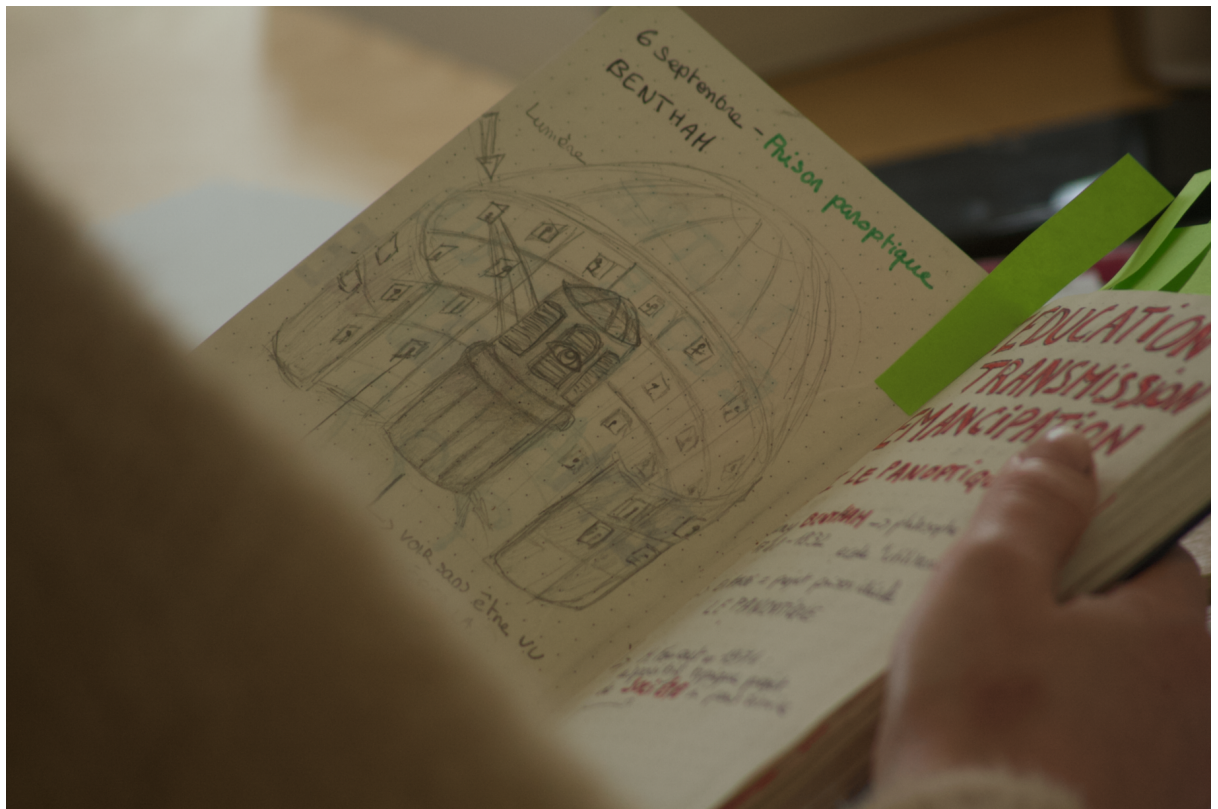
Exemple de cahiers et de dessins d'élèves réalisés durant cette expérimentation.

Les pages qui ont été choisies l'ont été par des élèves dans le carnet des autres élèves en fonction de ce qu'ils leur plaisaient dans le carnet des autres.