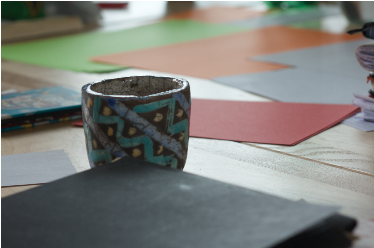
Une des tasses raku de la gare, comme potentiel objet d'exposition.

L'équipe Quartier Rouge à choisi les tasses raku de la gare pour servir de base à la réflexion lors de cet atelier.